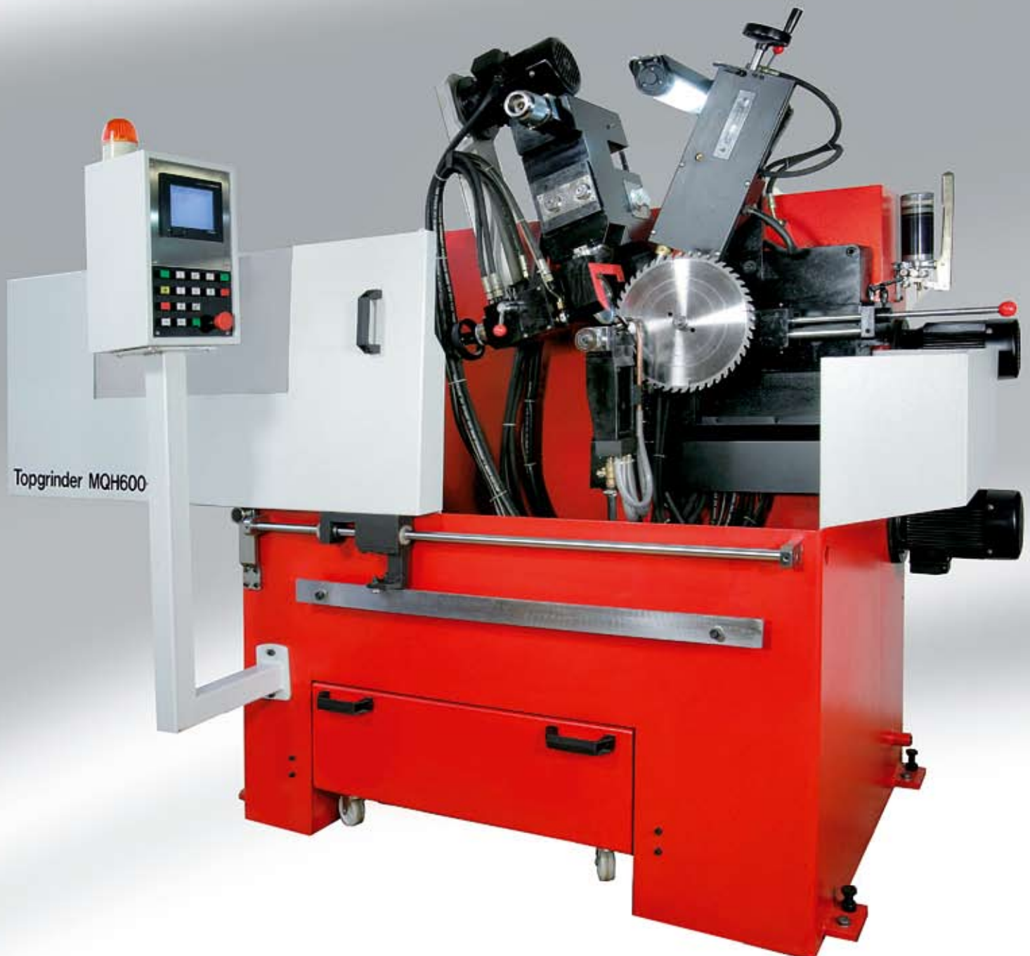
Szlifierka do tarcz Topgrinder MQH600-B-C